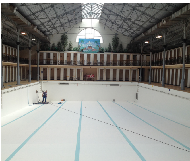
Het zwembad van Elsene tijdens de renovatiewerkn

Op 16 mei 2004 vierde dit zwembad zijn honderdste verjaardag, het is hiermee het oudste overdekte zwembad in het Brussels gewest. Het zwembad, ontworpen door de beroemde Franse architect François Hennebique, is ook een van de eerste met een zwembassin in gewapend beton. Het zwembad van Elsene is het enige dat is bewaard gebleven en nog een beeld geeft van de eerste gemeentelijke overdekte zwembaden. Het maakt deel uit van het architectuurpatrimonium van de gemeente. Dit zwembad wordt sinds 2020 gerenoveerd en zal vermoedelijk halweg 2024 de deuren opnieuw openzetten. De gevel en de zwembadhal, met inbegrip van het zwembad zelf, zijn beschermde erfgoedelementen en zullen in hun oorspronkelijke staat worden hersteld. Ook de typische indeling, met de kleedhokjes rond het zwembad blijft behouden.