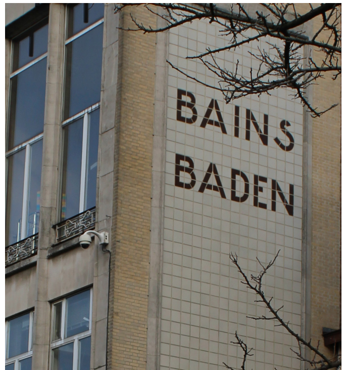
De Baden van Brussel, in de Marollen