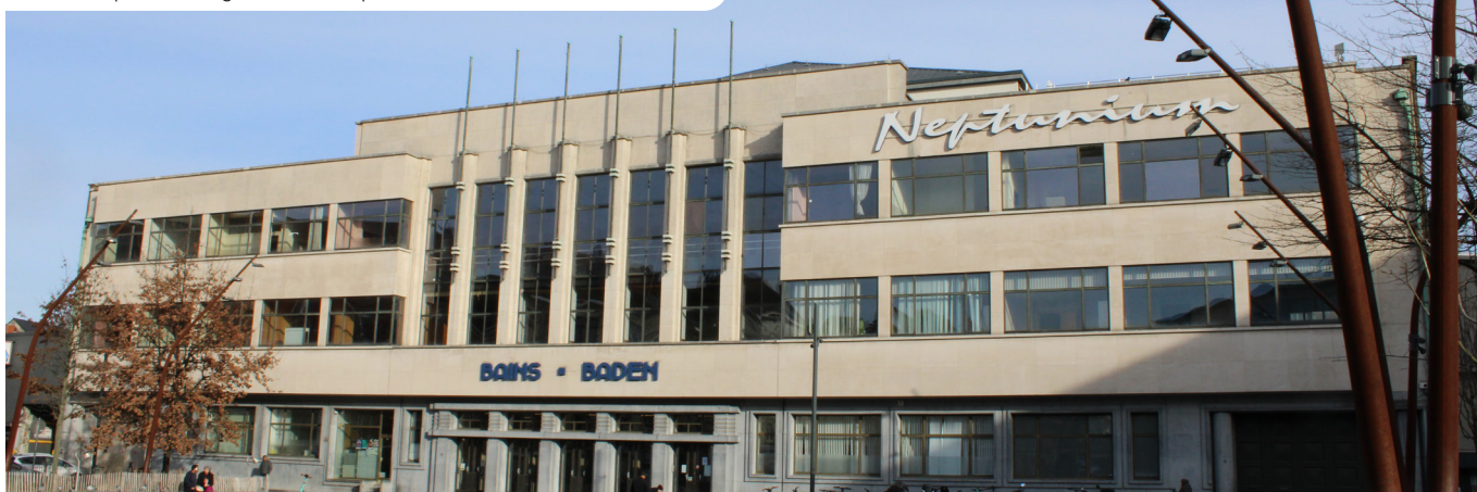
De imposante voorgevel van het Neptunium

Het gebouw werd grondig gerenoveerd: asbestverwijdering, structurele verbeteringen, herstel van waterdichting, vernieuwing van elektriciteit, energiezuinige maatregelen, modernisering van de inrichting. Zo zijn kleedkamers heringericht, nieuwe kleedkamers voor families en mindervaliden toegevoegd, en werd een modern toezichtstelsel met camera's geïnstalleerd. Het interieur is opgefrist met behoud van de modernistische architectuur uit de jaren '50.