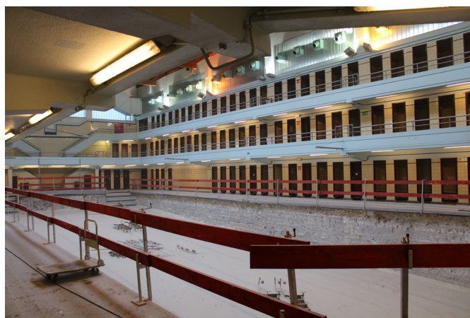
Het zwembad Victor Boin tijdens de werken

Het complex zal aan de huidige normen en eisen worden aangepast, en de organisatie van de interne werking wordt opnieuw vormgegeven. Het gebruikscomfort zal worden verhoogd, ondermeer door de toegang voor personen met beperkte mobiliteit en de veiligheid te verbeteren. De verdeling van de ruimten wordt herbekend: nieuwe familiecabines worden gecreëerd op het gelijkvloers, de cafetaria wordt opnieuw ingericht en nieuwe kantoorruimte voor het personeel worden ondergebracht in de uitbreiding op de 2de verdieping.