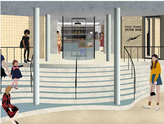
Ontwerptekening van de inkom van het Victor Boin zwembad (Foto AAC Architecture)

Dat Brussel heel wat te bieden heeft aan liefhebbers van Art Nouveau, Art Deco en Moderne architectuur is genoegzaam bekend. Wereldwijd trekt het Brusselse aanbod aan architectuur van rond de eeuwwisseling en uit het Interbellum, toeristen aan. Minder gekend is dat een groot deel van de Brusselse openbare zwembaden stamt uit het begin van de vorige eeuw, en dat sommige van deze openbare zwembaden in Brussel architecturale pareltjes zijn. Sommige van deze badhuizen zijn recent gerenoveerd, andere zullen binnenkort opnieuw de deuren heropenen. Het loont zeker de moeite om er, na de heropening, een bezoek aan te brengen.