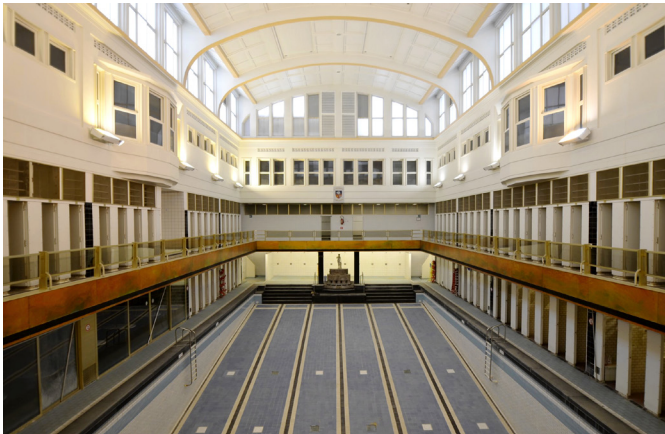
Het interieur van het zwembad van Sint-Joost-ten-Node