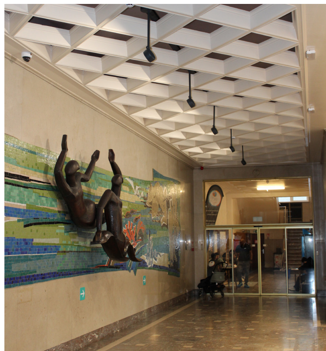
Kunst in het Neptunium - mozaïek in Muranoglas, van Géo deVlamynck en waternimfen in gehamerd koper, van Stan Hensen

Adres: Jeruzalemstraat 58 te 1030 Schaarbeek.