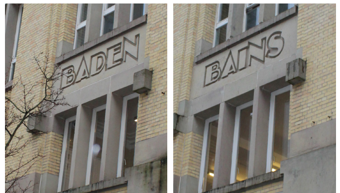
Het badencomplex van Sint-Joost-ten-Node

De iconische badhuizen uit de eerste helft van de vorige eeuw, in Art Deco-stijl of pakketbootstijl, hadden sportieve, hygiënische, maar ook sociale functies. Individueel huishelijk sanitair was nog niet zo ingeburgerd als vandaag, dus de meeste zwembaden werden door de toenmalige buurtbewoners ook als badkamer en als ontmoetingsplaats gebruikt. Men kwam er zich wassen onder de douche en in sommige badhuizen konden meer begoede burgers ook van een stoombad genieten. De zwembaden waren oases waar de Brusselse bevolking genoot van verfijnde recreatie.