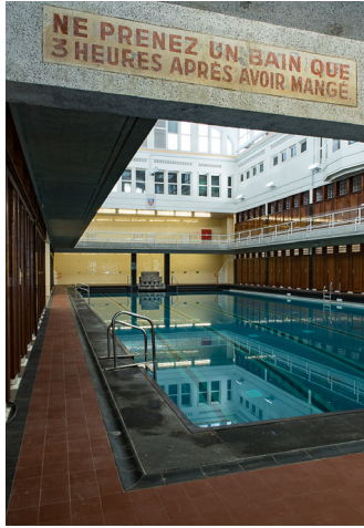
Het interieur van het zwembad van Sint-Joost-ten-Node (Foto AAC Architecture)

Het zwembad van Sint-Joost-ten-Node is zonder twijfel een van de mooiste van Brussel. De inkomhall en traphall zijn overvloedig voorzien van marmeren vloer- en wandbekleding.