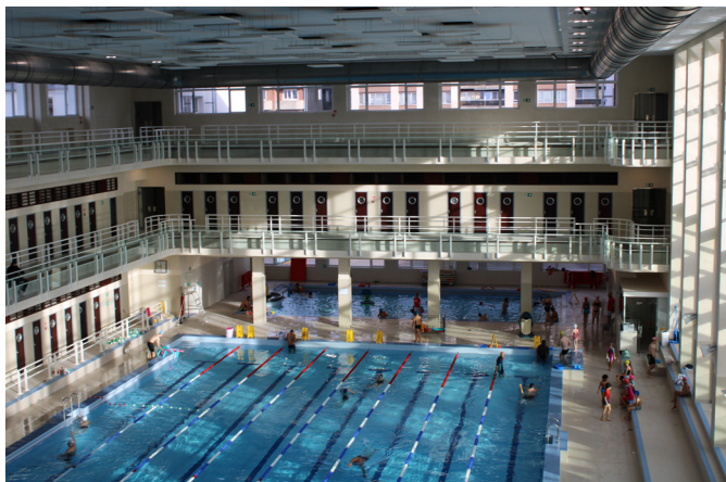
Groot zwembad en instructiebad van het Neptunium

Het Schaarbeekse zwembad Neptunium is een geslaagd voorbeeld van de pakketbootstijl, of Streamline Design. Talloze boegvormige elementen, patrijspoorten en ballustrades verwijzen naar scheepsbouw.