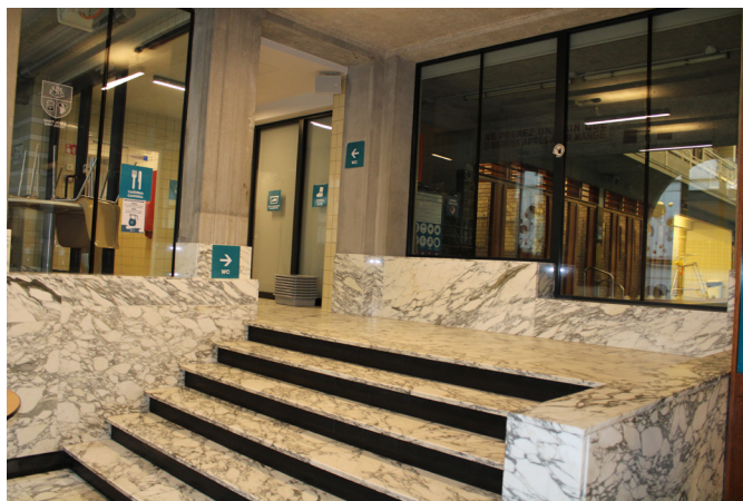
Overvloedig gebruik van marmer in Sint-Joost-ten-Node

De gevel, de monumentale inkomhal met grote marmervlakken en de rijen kleedkamers rond het zwembad en op de eerste verdieping werden allemaal bewaard.