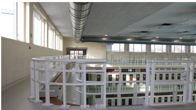
Leuningen, patrijspoorten en lange rechte lijnen roepen een maritieme sfeer op in het Neptunium

Het Neptunium werd geopend in 1953, en werd in 1957 uitgebreid. Destijds voldeed het Neptunium met zijn 33-meterbad aan de Olympische normen. Het zwembad werd tussen 2017 en 2023 gerenoveerd en is ondertussen heropend.