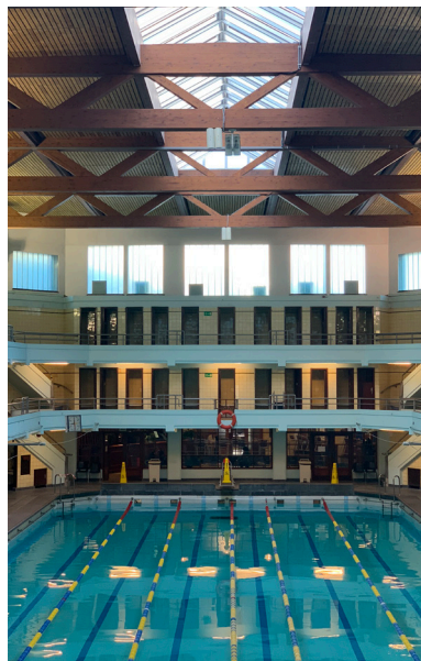
Het zwembad Victor Boin voor de werken

Het complex zal aan de huidige normen en eisen worden aangepast, en de organisatie van de interne werking wordt opnieuw vormgegeven. Het gebruikscomfort zal worden verhoogd, ondermeer door de toegang voor personen met beperkte mobiliteit en de veiligheid te verbeteren. De verdeling van de ruimten wordt herbekend: nieuwe familiecabines worden gecreëerd op het gelijkvloers, de cafetaria wordt opnieuw ingericht en nieuwe kantoorruimte voor het personeel worden ondergebracht in de uitbreiding op de 2de verdieping.