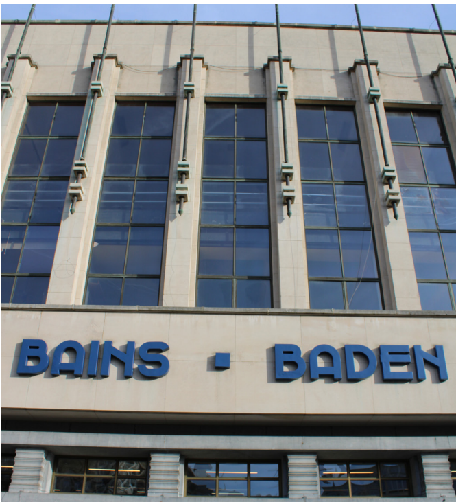
De voorgevel van het Neptuneium in Schaarbeek