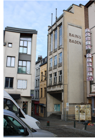
De verticaal gerichte gevel van de Baden van het Centrum, in moderne stijl

Met zijn strakke vormgeving, reusachtige glaspartijen en twee zwembassins boven elkaar, is dit sport- en zwemcomplex al decennia bekend als een van de knapste staaltjes Brusselse architectuur op de snijlijn van Art Deco en Modernisme.