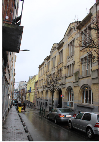
De monumentale gevel van het zwembad van Sint-Joost-ten-Node

Dit prachtige openbare Art-Decogebouw werd tussen 2009 en 2019 zorgvuldig gerestaureerd.