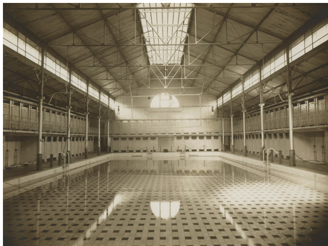
Zo zag het zwembad van Elsene er begin vorige eeuw uit

Op 16 mei 2004 vierde dit zwembad zijn honderdste verjaardag, het is hiermee het oudste overdekte zwembad in het Brussels gewest. Het zwembad, ontworpen door de beroemde Franse architect François Hennebique, is ook een van de eerste met een zwembassin in gewapend beton. Het zwembad van Elsene is het enige dat is bewaard gebleven en nog een beeld geeft van de eerste gemeentelijke overdekte zwembaden. Het maakt deel uit van het architectuurpatrimonium van de gemeente. Dit zwembad wordt sinds 2020 gerenoveerd en zal vermoedelijk halweg 2024 de deuren opnieuw openzetten. De gevel en de zwembadhal, met inbegrip van het zwembad zelf, zijn beschermde erfgoedelementen en zullen in hun oorspronkelijke staat worden hersteld. Ook de typische indeling, met de kleedhokjes rond het zwembad blijft behouden.